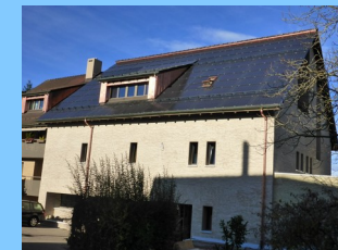
2015: 24 kW Itschnach