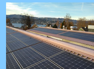
2018: 34 kW Seewasser