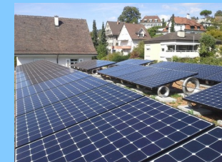
2015: 12 kW Wiesenstr.