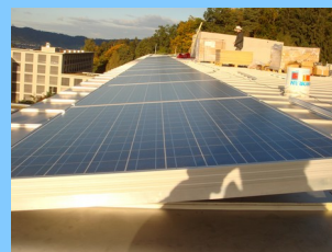
2008: 9.5 kW Bethesda I