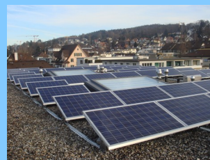
2007: 10 kW COOP