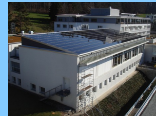
2010: 32 kW Bethesda III