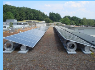
2009: 30 kW Bethesda II