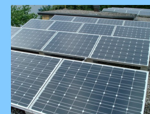
2005: 5.4 kW Kusenbad